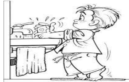
شستشوی دستها با آب و صابون