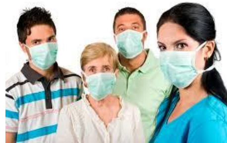
استفاده از ماسک