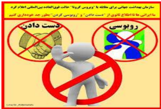
پرهیز از دست دادن و روبوسی