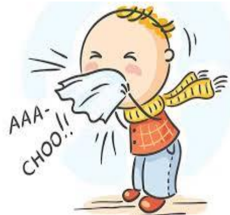
استفاده از دستمال کاغذی به هنگام عطسه و سرفه